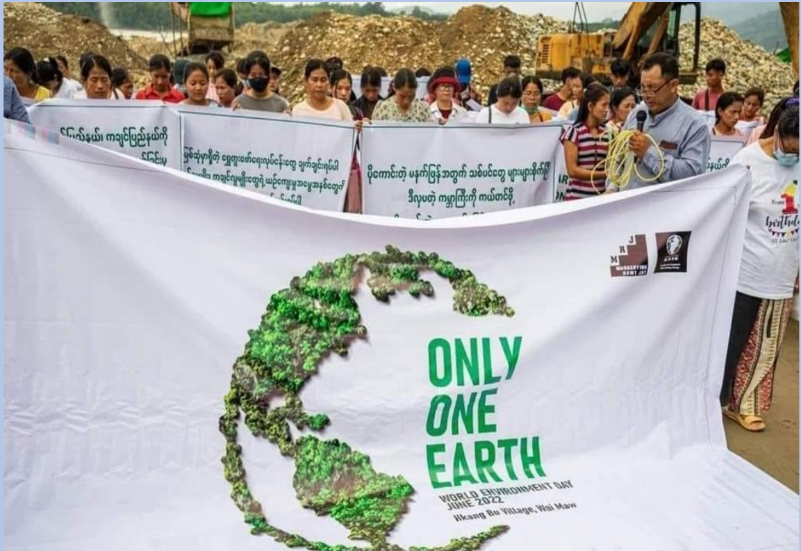
Taken photo near the riverbank of Myitstone during the occasion of World Environment Day June 5, 2022, at Hkang Bu village, Waimaw township.

ရေယာမှာ အလုပ်လုပ်ကြတယ်။ သူတို့က မိဘတွေနောက် လိုက်ပြီး ကူလုပ်ပေးတယ်။ လူငယ်တွေက ရေပိုက်တွေကို သယ်နိုင်ရင် သူတို့မိဘတွေကို ကူကြပြီးတော့ မိဘတွေကလဲ ခွင့်ပြုတယ်။ မိဘတွေက သူတို့သားသမီးတွေကို ကျောင်းပို့ချင်ပေမယ့် စကစ စစ်အုပ်ချုပ်ရေးစနစ်အောက်မှာတော့ သူတို့သားသမီးတွေကို ကျောင်းမတက်စေချင်ဘူး။ ရွှေတူး တဲ့ အလုပ်က မိသားစုရဲ့ ငွေကြေးအခက်အခဲအတွက် ခဏတာ အထောက်အကူတော့ ဖြစ်ပါတယ်။”