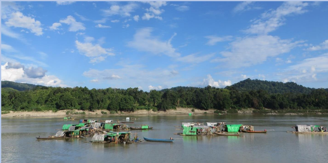
မြစ်ဆုံအောက်ပိုင်းရှိ လှေများတွေ့ရပြီး ရေငုပ်သမားတို့၏ နေ့စဉ်ဘဝကို ရေအောက်တွင် ရွှေရှာကြသည်။

လွန်ခဲ့သော စစ်အာဏာရှင်လက်ထက်တွင် ရောဝတီမြစ်ဆုံ၌ အကြီးစား ရေအားလျှပ်စစ် စီမံကိန်းတစ်ခု တည်ဆောက်ရန် စီစဉ်ခဲ့သည်။ ၎င်းစီမံကိန်းကို မြစ်ဆုံဆည်စီမံကိန်းဟု ခေါ်ဆိုခဲ့သည်။ ဤစီမံကိန်း အတွက် ဒေသခံတို့ကို အတင်းအဓမ္မပြောင်းရွှေ့ခိုင်းစေသည်။ ဒေသခံများ ရွှေပြောင်းပြီးနောက် မြေနေရာများ လစ်လပ်လာကာ ရွှေသတ္တုတွင်းလုပ်သားများ လုပ်ငန်းစတင် လည်ပတ်ကြသည်။ သို့သော်လည်း သိန်းစိန်အစိုးရလက်ထက် ၂၀၁၁ ခုနှစ် စက်တင်ဘာလတွင် အဆိုပါစီမံကိန်းကို ရပ်ဆိုင်း ခဲ့ပါသည်။ ထိုအချိန်မှစပြီး ၂၀၂၁ခုနှစ် ဖေဖော်ဝါရီလ အာဏာသိမ်းချိန်အထိ ရွှေတူးဖော်မှုလုပ်ငန်းများ နည်းပါးလာခဲ့ပြီး အာဏာသိမ်းပြီးချိန်မှ စ၍ ရွှေအလှအယက်တူးဖော်မှုအိမ်မက်ဆိုးများက ရွာသားများ နှင့် ၎င်းတို့၏ သဘာဝပတ်ဝန်းကျင်ထံ ပြန်လည်ရောက်ရှိလာပါတော့သည်။