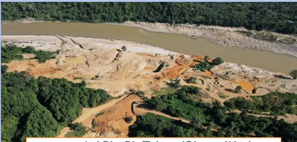
ရွှေတူးဖော်မှုတိုးမြှင့်လာခြင်းကြောင့် ရောဂါဖြစ်ဆုံအောက်ပိုင်းတွင် သစ်တောပြုန်းတီးမှုနှင့် ရေလမ်းကြောင်းညစ်ညမ်းမှု တိုးမြှင့်လာပုံ

“မိုင်းက ဖုန်မှုန့်တွေက တအိမ်လုံးကို ဖုံးစေတယ်။ အစာတွေမှာ၊ အပင်တွေ နှင့် အဝတ်တွေမှာ အမြဲဖုန်တွေ ပေနေတယ်။ ဖုန်ရှင်းရတာ တနေ့ကို အကြိမ်ပေါင်းများစွာ ရှင်းရတယ်။ ကျန်းမာရေး လဲထိခိုက်မှာ စိုးရိမ်မိတယ်။” အင်ဂန်း ကျေးရွာမှ အမျိုးသမီးတစ်ဦးက ပြောပြသည်။