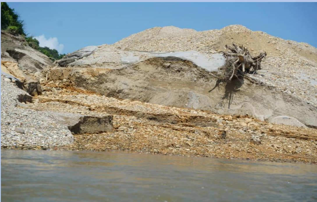
မြစ်ဆုံကမ်းနံဘေးတွင် ရွှေတူးဖော်ပြီးနောက် ပျက်စီးသွားခဲ့သည့် မြေများနှင့် စွန့်ပစ်မြေစာများကို မြစ်အနီးတွင်စွန့်ပစ်ထားပုံ

စွန့်ပစ်မြေများကို ထပ်ခါထပ်ခါပြန်လည်အသုံးပြုခြင်းကြောင့် မြစ်ချောင်းများနှင့် မြစ်များသည် အမဲရောင်သမ်းလာပြီး ရွှံ့များသဖွယ် ဖြစ်လာသည်။ ယင်းကြောင့် မြစ်ချောင်းများနှင့် မြစ်များ၏ ဂေဟစနစ်အပေါ် မှီခိုနေသည့် သစ်ပင်ပန်းမန်များနှင့် တိရိစ္ဆာန်များ ကွယ်ပျောက်သွားကြသည်။ ဒေသခံများအတွက် မျိုးစုံသော ငါးများ ရှိခဲ့သော်လည်း ဓာတုပစ္စည်းအဆိပ်များကြောင့် (သို့မဟုတ်) ပြောင်းရွှေ့သွားခြင်းကြောင့် ငါးများလည်း ပျောက်ကွယ်သွားကြသည်။ ထို့အပြင် ရပ်ရွာဒေသက အသုံးပြုနေကြသည့် ဆေးဖက်ဝင်အပင်များကိုလည်း မတွေ့ရှိရတော့ပေ။