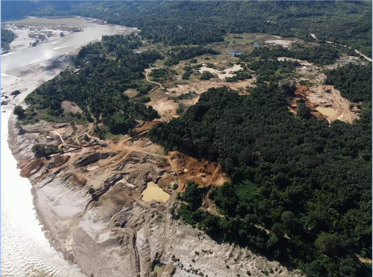
မြစ်ဆုံတွင် ရွှေတူးဖော်ရေးလုပ်ငန်း အရှိန်အဟုန်မြင့်နေသည့်အခြေအနေကို ဒရုန်းဖြင့်ရိုက်ထားသောပုံ

မိုင်းတွင်းမဟုတ်သော အနီးနားရှိ နေရာများတွင်လည်း ဖျက်ဆီးမှုများ ဖြစ်ပွားနေပြီး ဟု အခြား ရွာသားတစ်ဦးက ပြောပါသည်။ “ရွှေတူးဖော်မှု မြေဧက ၅၀ခန့် ပျက်စီးခဲ့ပြီး အာဏာသိမ်းပြီးခြင်း နောက်ထပ်ဧက ၂၀ ဆုံးရှုံးသွားခဲ့တယ်။ ဒီလိုအဖြစ်အပျက်တွေ မြင့်တက်လာနိုင် ဖွယ်ရှိပါတယ်။”